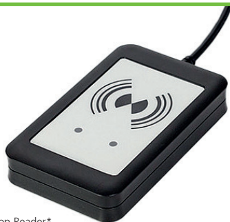
RFID USB Desktop Reader* Weitere Varianten und kundenspezifische Konfigurationen setzen wir gerne auf Anfrage für Sie um.